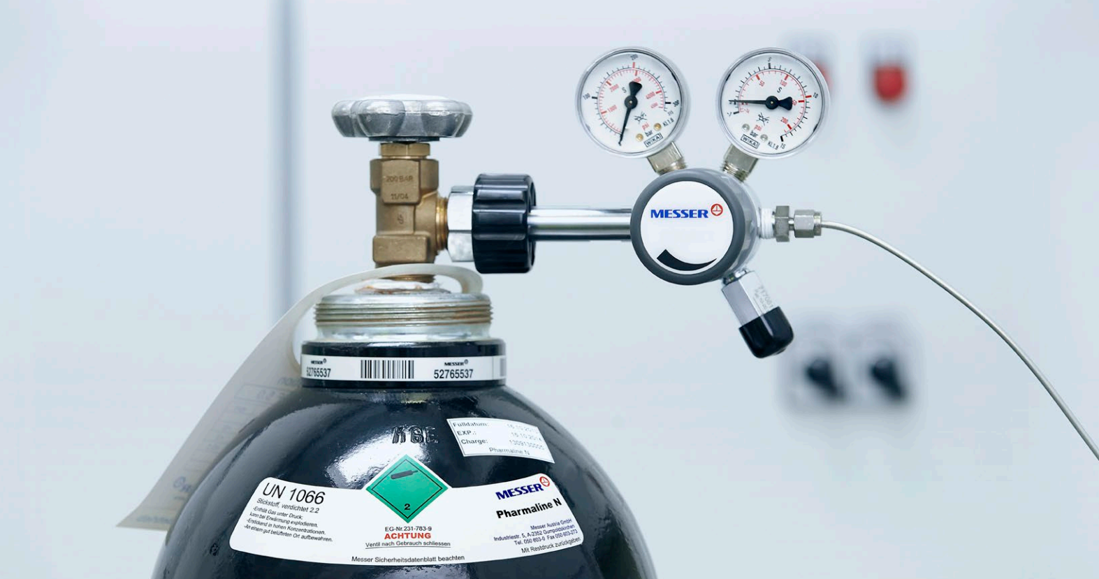
Botella individual en el punto de uso con regulador de presión