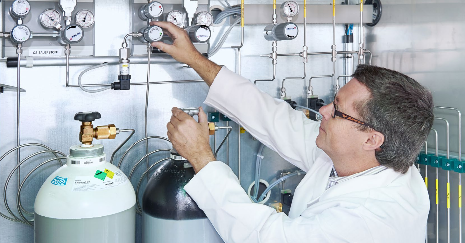
Sistema centralizado de suministro de gas